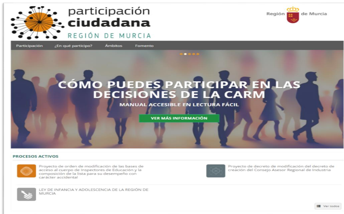
Ilustración 1. Portada de la Plataforma de Participación Ciudadana